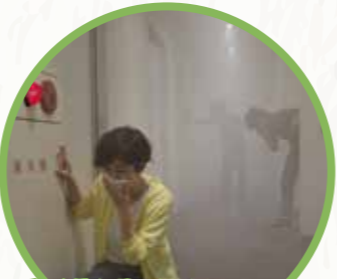
2F 피난 체험 코너 (피난 체험실)

진도 4~7의 지진을 체험하고, 지진발생시의 대처방법과 평소에 대비해야 할 사항들에 대해 소개합니다. (20분)