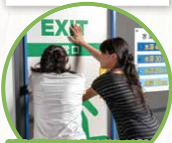
3F 수압 문 체험코너 (4D 상영관 내)

[지하공간에서의 침수의 공포]를 테마로 4D 상영시스템으로 표현해, 수해 시 행동요령에 대해 생각해 보는 곳입니다. (20분)