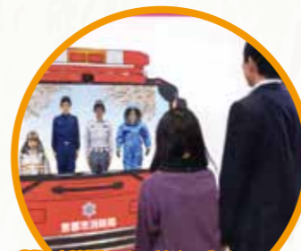
3F 소방관으로 변신!!

지하 차도에 폭우가... 차에서의 탈출, 도보의 위험, 침착하게 대처 가능할 것인가?