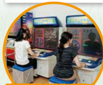
3F 방재 학습 미니게임

3D와 CG 기술로 만든 '불'과 '물'로 실제 화재처럼 재현한 소방 시뮬레이션 게임입니다. 과연 사람들을 구출하고 화재를 진압할 수 있을까?