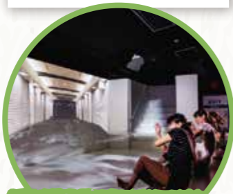
3F 4D 상영관 (엄습해오는 지하도로의 공포)

소화기 사용법을 배우고 모니터에 나오는 모의 화재 진압을 체험해 볼 수 있습니다. (20분) (체험은 9살 이상부터 가능합니다)