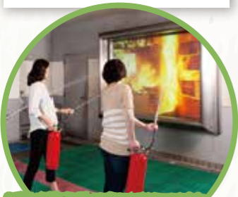
2F 소방 체험 코너 (소방 훈련실)

호텔화재현장을 재현해, 평소 체험할 수 없는 연기 속에서 피난행동을 체험합니다. (20분)