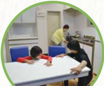
1F 지진 체험 코너 (지진 체험실)

풍속 32미터의 강풍속에서의 위험성을 체험, 자연재해에 대해 소개합니다. (20분)