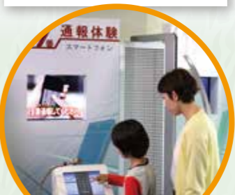
2F 신고 체험 코너

퀵レス큐, 점프 레스큐, 파이어 레스큐는 블록 깨기와 지진, 화재 등을 주제로 한 학습 게임입니다.