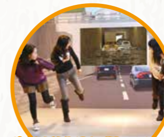
3F 지하공간에서의 침수의 공포

지하 차도에 폭우가... 차에서의 탈출, 도보의 위험, 침착하게 대처 가능할 것인가?