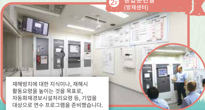
2F 종합훈련실 (방재센터)

재해방지에 대한 지식이나, 재해시 활동요령을 높이는 것을 목표로, 자동화재경보시설처리요령 등, 기업을 대상으로 연수 프로그램을 준비했습니다.