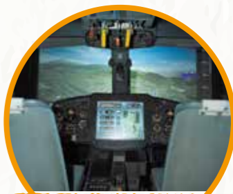
3F 시뮬레이터 Air Rescue Pilots

구조 출동! 소방 헬리콥터! 히에이호를 타고 헬기 조종 체험을 할 수 있습니다. 주어진 미션을 달성해 봐!