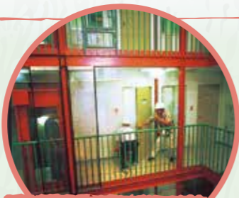
2F-3F 종합훈련실 (모의 건물)

재해방지에 대한 지식이나, 재해시 활동요령을 높이는 것을 목표로, 자동화재경보시설처리요령 등, 기업을 대상으로 연수 프로그램을 준비했습니다.