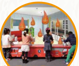
3F 출동!!! 어린이소방대