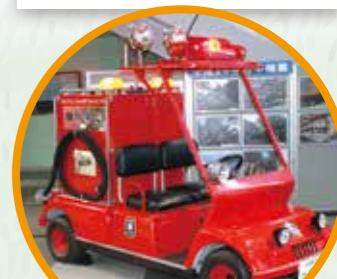
1F 어린이 소방대

스마트폰이나 유선전화 등의 전화로 119에 신고하는 과정을 체험해 볼 수 있습니다.