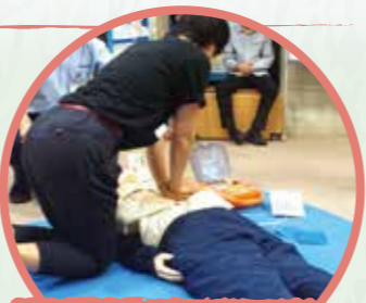
2F 생활과 안전 코너

물품 판매점, 호텔, 공동주택 등 다양하게 구성된 모의 건물에서 화재 발생 시 취해야 할 행동요령에 대해 종합적으로 훈련합니다.