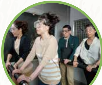
1F 강풍 체험 코너 (강풍 체험실)

고화질 영상 시스템으로, 교토의 지진부터, 각종 재해의 역사와 무서움 등에 대하여 소개합니다. (20분)