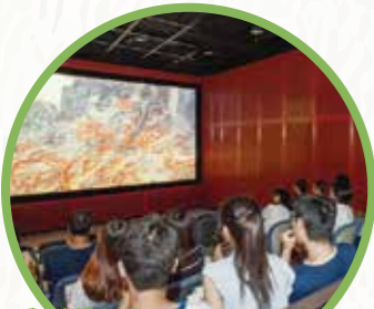
1F 영상체험 코너 (영상 체험실)

고화질 영상 시스템으로, 교토의 지진부터, 각종 재해의 역사와 무서움 등에 대하여 소개합니다. (20분)