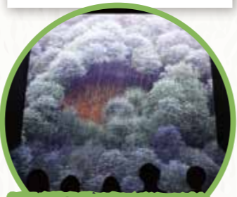
3F 토사 재해 체험 코너

침수되어 문에 수압이 가해졌을 때 얼마나 문을 열기 힘들지 체험해 볼 수 있습니다.